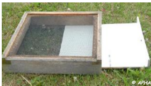
Photo 1 : Tiroir de fond de ruche associé à un plancher grillagé, utilisables pour le comptage de chutes naturelles de varroas